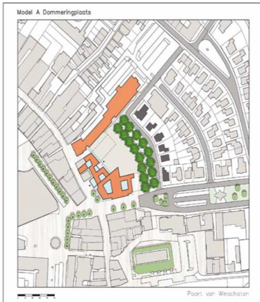
. Afbeelding 1: Variant 4, Complete Afronding Stadshart

De financiële vertaling van variant 4 vindt u in vertrouwelijke bijlage 1.